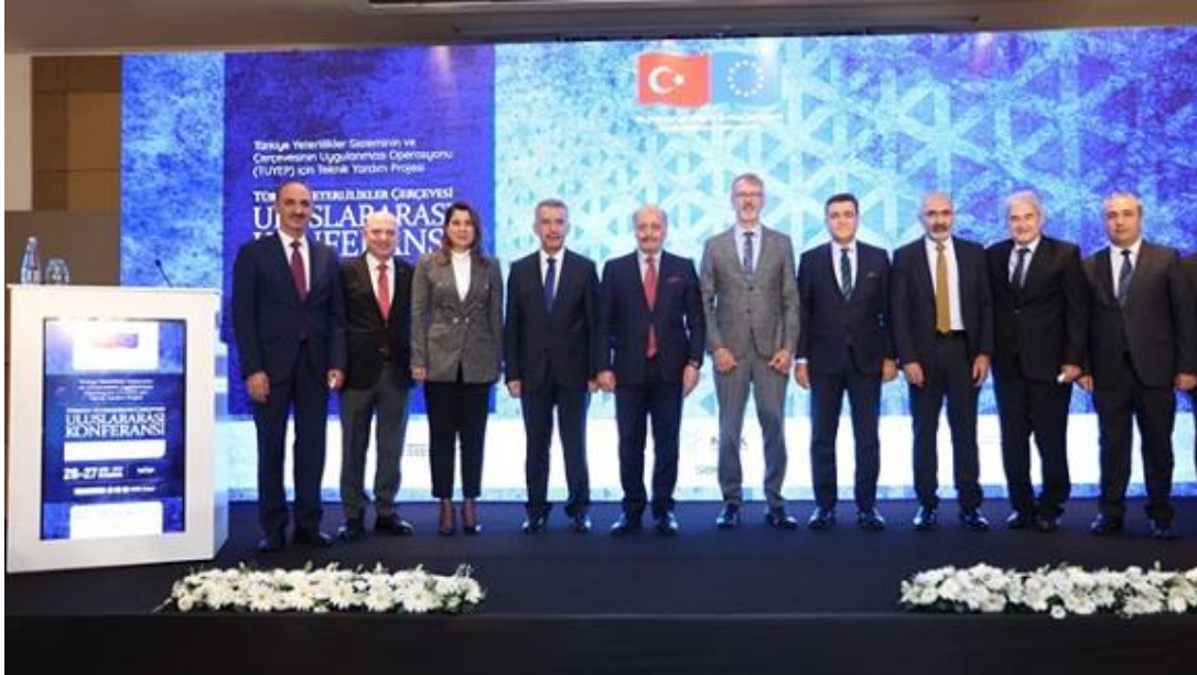
Resim: 26-27 Ekim 2022 tarihli TYÇ Uluslararası Konferans

Konferansın ikinci gününün açılışı Çalışma ve Sosyal Güvenlik Bakanı Sayın Prof. Dr. Vedat BİLGİN tarafından gerçekleştirilmiştir. Sayın Bakan konuşmasında mesleki farklılaşmanın ve işbölümünün sanayii çağının temel kavramlarından biri olduğunu vurgulayarak mesleki yeterliliğin modern toplumun en temel unsurlarından olduğunu ifade etmiştir.