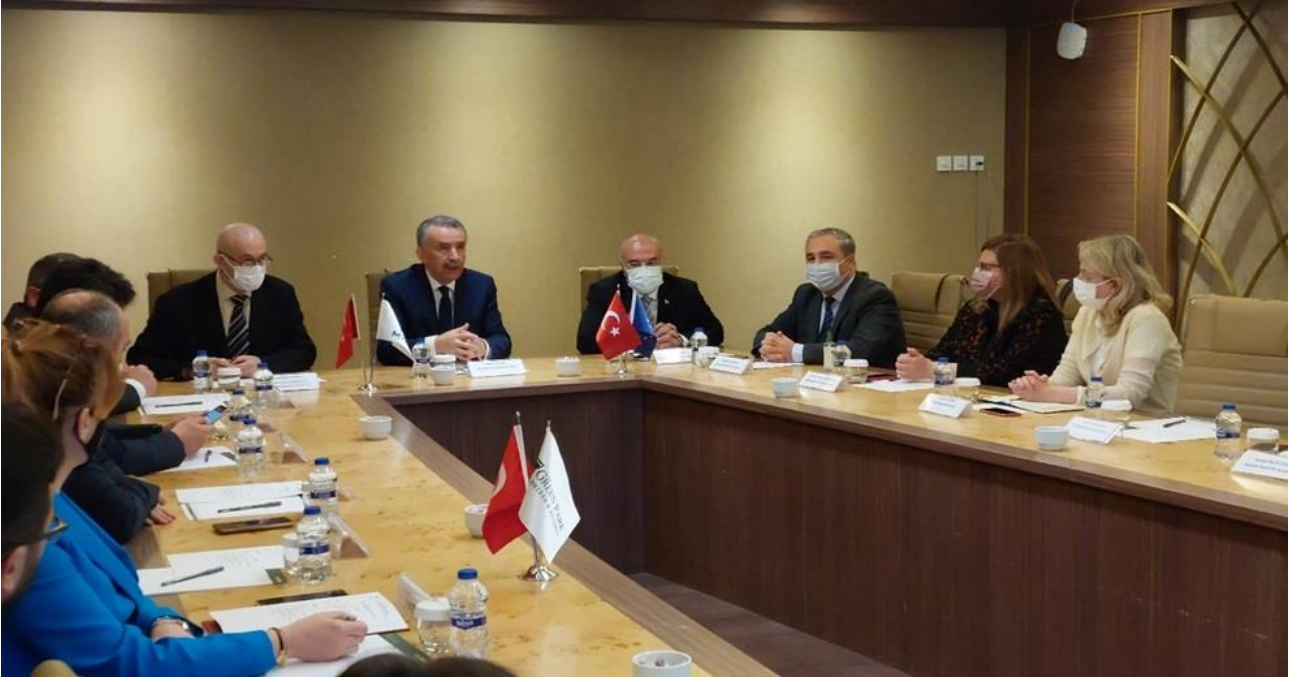
Resim: 29 Mart 2022 Tarihli TYÇ Kurulu 38. Toplantısı

Önümüzdeki süreçte de, yeterliliklerin TYÇ'ye yerleştirilmesine devam edilerek yeterliliklerin şeffaflığı, güvenilirliği ve hareketliliği ulusal ve uluslararası düzeyde artırılabilecektir.