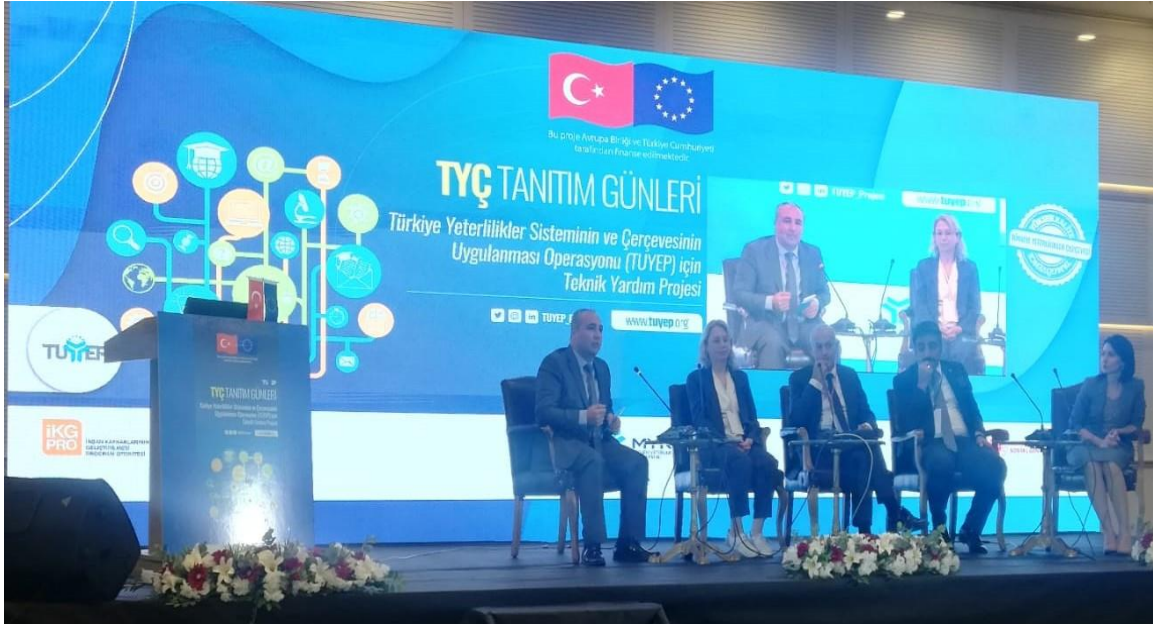
Resim: 27 Eylül 2022 tarihli TYÇ Tanıtım Günleri Etkinliği-Ankara

25 Ağustos 2022 tarihinde İzmir, 15 Eylül 2022 tarihinde Trabzon, 27 Eylül 2022 tarihinde Ankara, 15 Ekim 2022 tarihinde Erzurum, 9 Kasım 2022 tarihinde Adana, 6 Aralık 2022 tarihinde Sakarya ve 27 Aralık 2022 tarihinde Diyarbakır'da düzenlenen etkinliklerde yerel aktörler arasında TYÇ'ye yönelik farkındalığının artması sağlanmıştır.