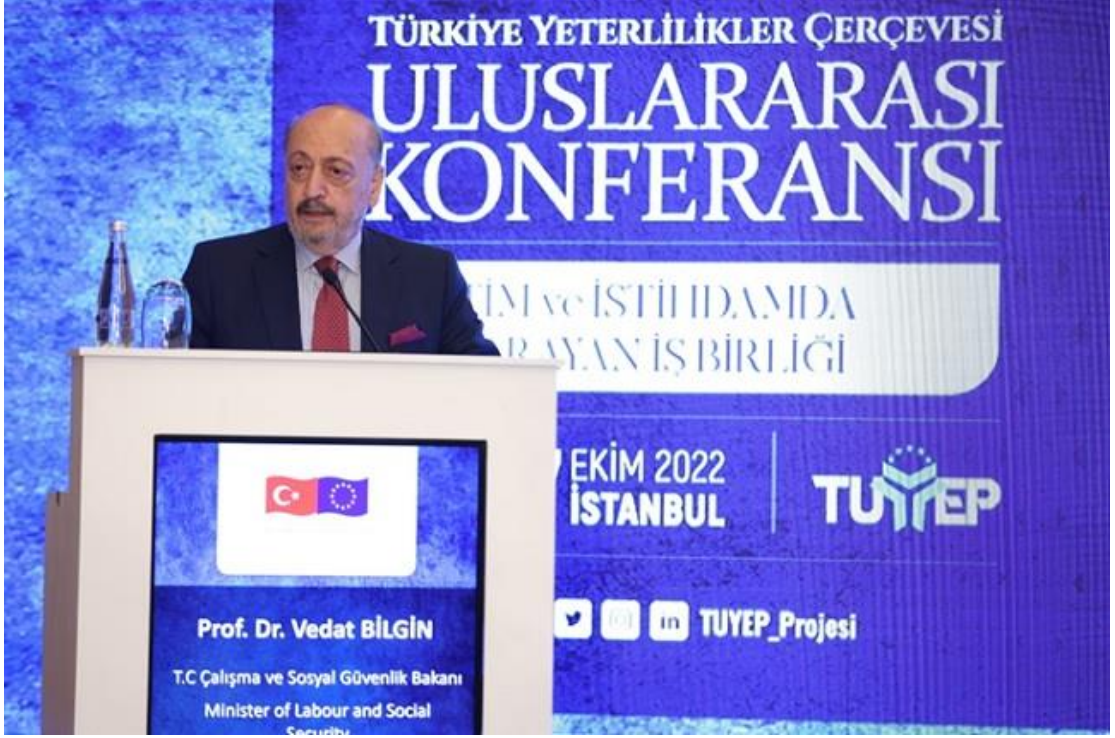
Resim: 26-27 Ekim 2022 tarihli TYÇ Uluslararası Konferans

TYÇ Uluslararası Konferansı 26-27 Ekim 2022 tarihlerinde T.C. Çalışma ve Sosyal Güvenlik Bakanı Sayın Prof. Dr. Vedat BİLGİN'in teşrifleri ile İstanbul'da gerçekleştirilmiştir.