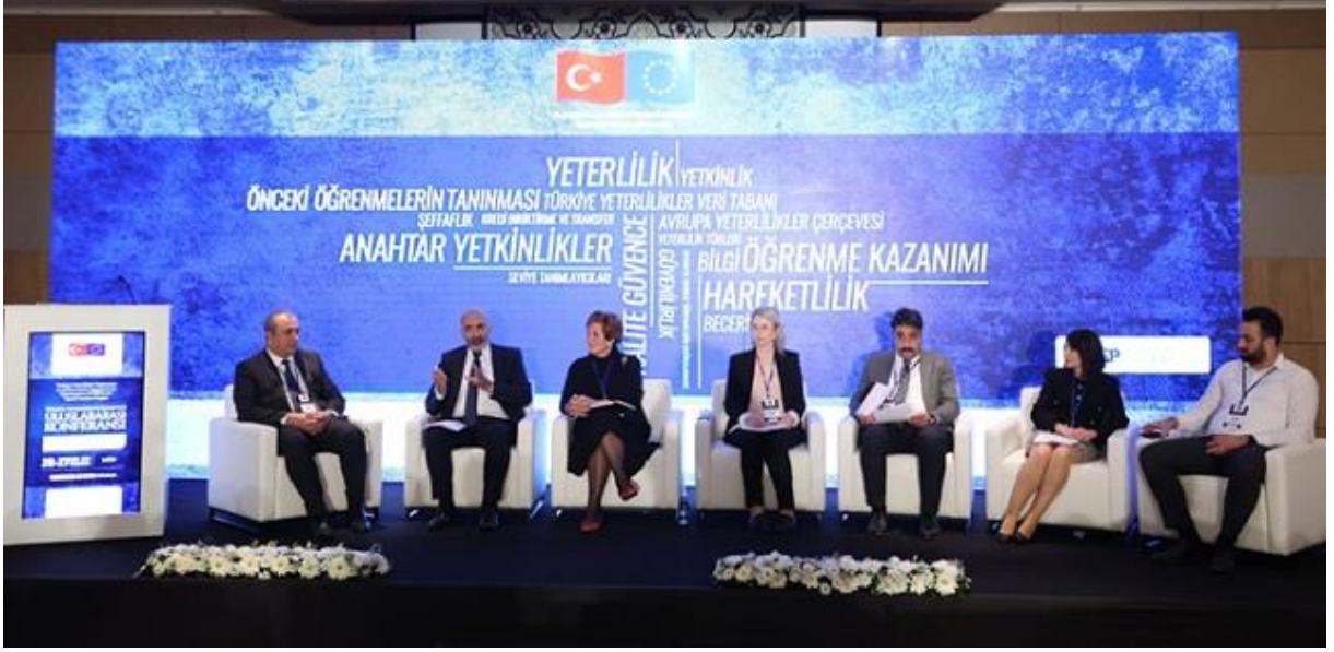
Resim: 26-27 Ekim 2022 tarihli TYÇ Uluslararası Konferans