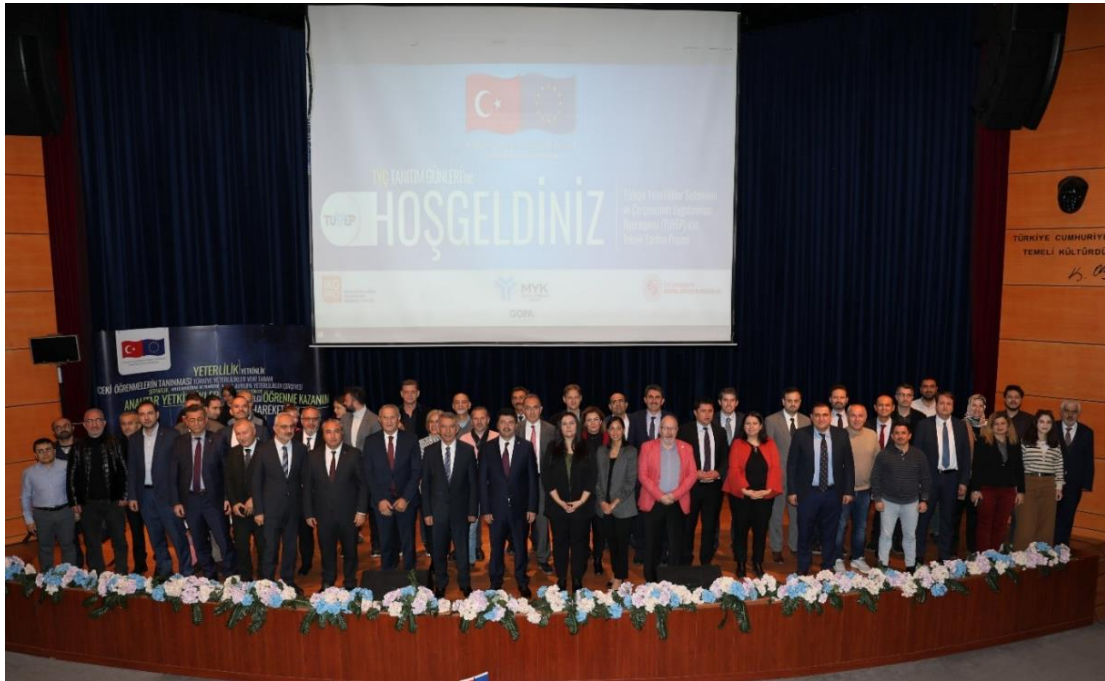
Resim: 6 Aralık 2022 tarihli TYÇ Tanıtım Günleri Etkinliği-Sakarya

Oldukça yoğun katılımı ile gerçekleştirilen TYÇ Tanıtım Günleri etkinlikleri paydaşların TYÇ'ye yönelik gerçekleştirdikleri faaliyetleri paylaştıkları panellerle son bulmuş ve kurumlararası işbirliklerinin güçlendirilmesinin gerektiği vurgulanmıştır.