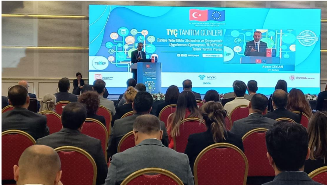
Resim: 27 Eylül 2022 tarihli TYÇ Tanıtım Günleri Etkinliği-Ankara

Rapor dönemi boyunca, TYÇ, AYÇ ve hayat boyu öğrenme kapsamındaki diğer şeffaflık araçlarıyla ilgili olarak ulusal ve uluslararası alanda tanıtım ve bilgilendirme faaliyetleri yürütülmüş, toplantı, çalıştay ve konferanslara katılım sağlanmıştır. Yapılan sunum ve konuşmalarla katılımcıların güncel gelişmeler hakkında bilgi sahibi olması sağlanmıştır.