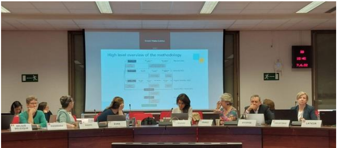
Resim: 7-8 Haziran 2022 tarihli AYÇ Danışma Grubu 59. Toplantısı

Yılda ortalama dört kez düzenlenen AYÇ Danışma Grubu toplantılarına katılım sağlanarak Avrupa düzeyindeki ve diğer ülkelerdeki gelişmeler takip edilmekte, ülkemizdeki gelişmeler sunulmakta, istişarelerde bulunulmakta ve kurumsal temaslar geliştirilmektedir. Bu kapsamda rapor dönemi boyunca, AYÇ Danışma Grubu'nun 57, 58 ve 59. Toplantılarına katılım sağlanmıştır.