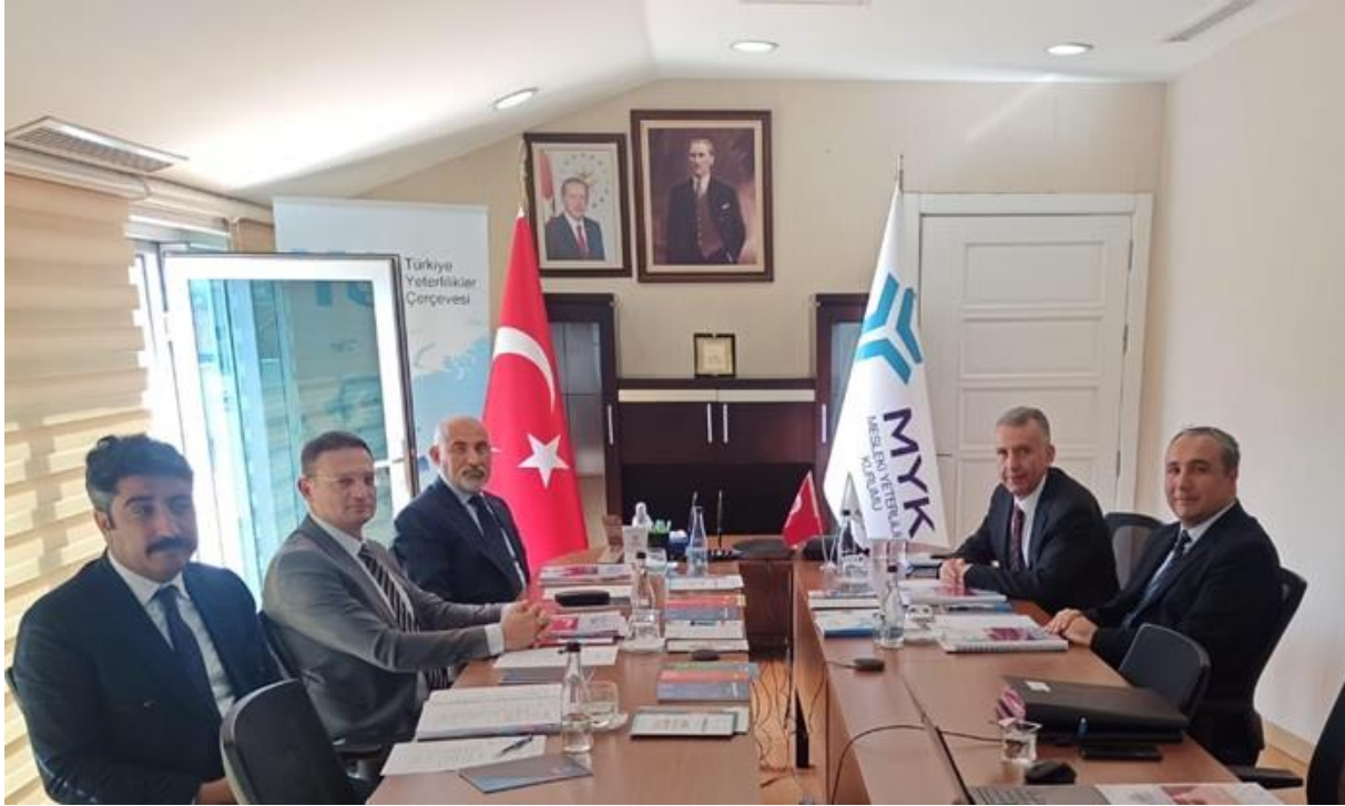
TYÇ Koordinasyon Kurulu 3. Toplantısı, 11 Ekim 2022

Toplantıda 2020-2022 yıllarında gerçekleştirilen çalışmalar sonucunda nihai halini kazanan altı farklı mevzuat düzenlemesi, faaliyet raporları ve eylem planları ile TYÇ'ye yerleştirilen yeterliliklere ilişkin liste oybirliğiyle onaylanmıştır.