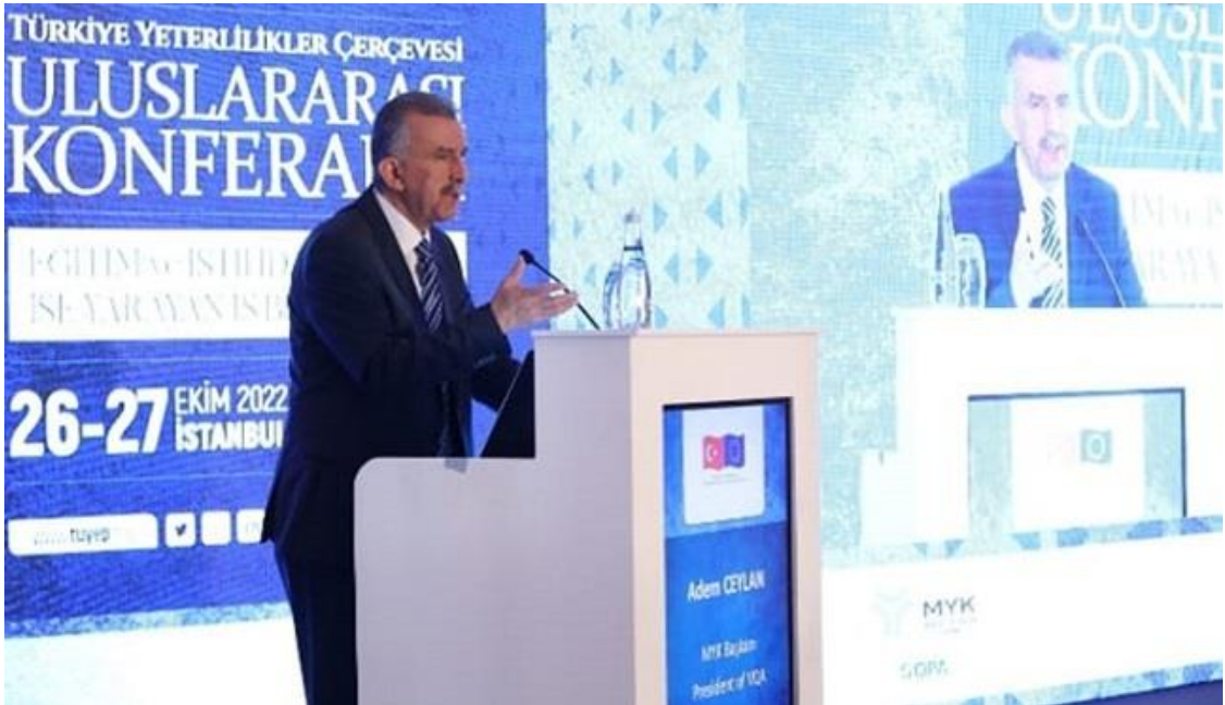
Resim: 26-27 Ekim 2022 tarihli TYÇ Uluslararası Konferans

TYÇ'nin uygulanması ve işgücü piyasasına nitelikli işgücü sağlanmasını amaçlayan TUYEP projesi kapsamında düzenlenen ve iki gün süren konferansta TYÇ konusunda yapılan çalışmalar ve bu konuda Avrupa'daki gelişmeler ele alınmıştır. Konferansa 17 farklı ülkeden alan uzmanları, Avrupa'da faaliyet gösteren 5 farklı uluslararası kuruluş temsilcisi, MEB, YÖK yükseköğretim kurumları ve sivil toplum kuruluşlarından katılım sağlanmıştır.