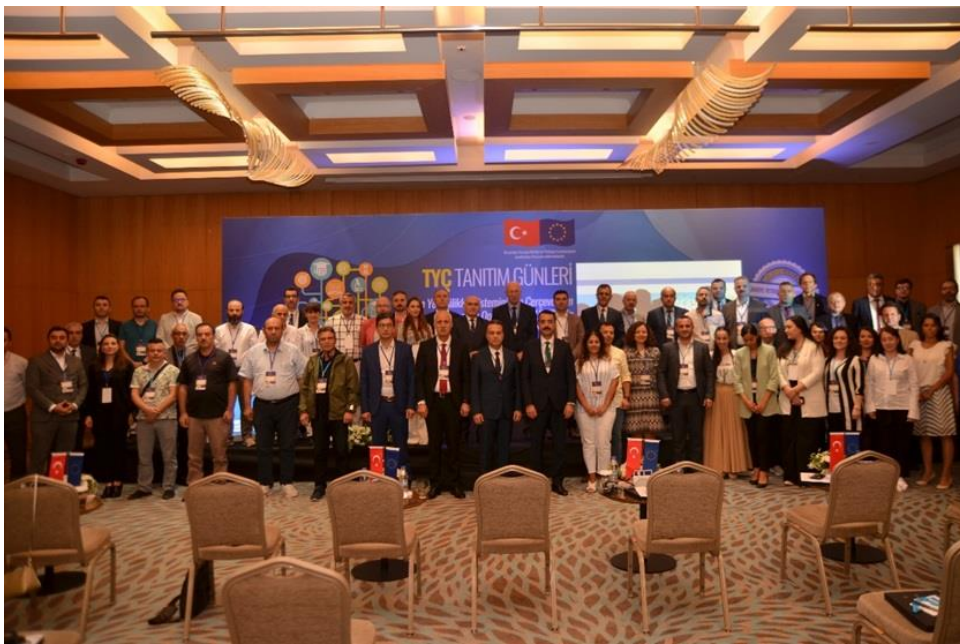
Resim: 15 Eylül 2022 tarihli TYÇ Tanıtım Günleri Etkinliği-Trabzon

2022 yılı içerisinde 7 farklı ilde gerçekleştirilen etkinliklere iş ve eğitim dünyasının üst düzey temsilcileri, bölge illerde bulunan yükseköğretim kurumlarından ve Millî Eğitim Bakanlığında temsilciler ile çok sayıda ulusal katılımcı iştirak etmiştir.