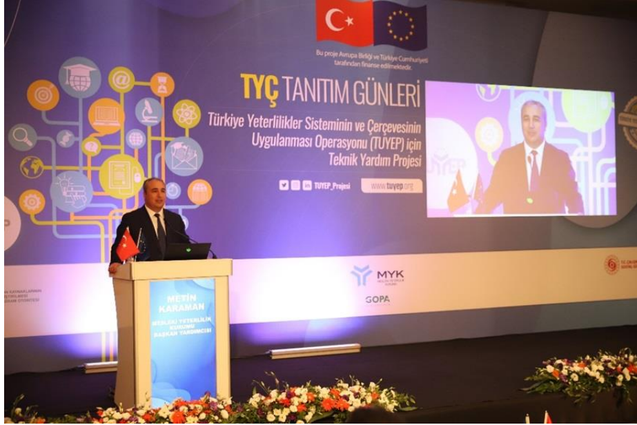
Resim: 25 Ağustos 2022 tarihli TYÇ Tanıtım Günleri Etkinliği-İzmir

TUYEP kapsamında Türkiye genelinde yedi ilde TYÇ ve TYÇ faaliyet alanları hakkında farkındalık oluşturma/artırmanın amaçlandığı etkinlikler düzenlenmiştir.