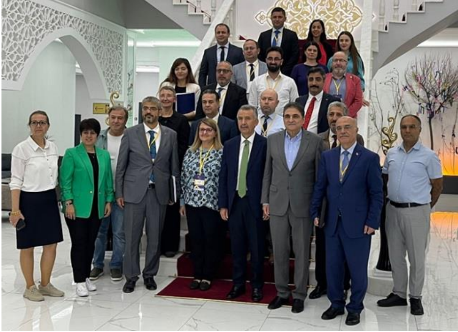
Resim: 03-04 Ekim 2022 tarihli TYÇ Kurulu Üyelerine Yönelik Eğitim

TUYEP kapsamında 03-04 Ekim 2022 tarihinde TYÇ Kurulu üyelerine yönelik eğitim düzenlenmiştir.