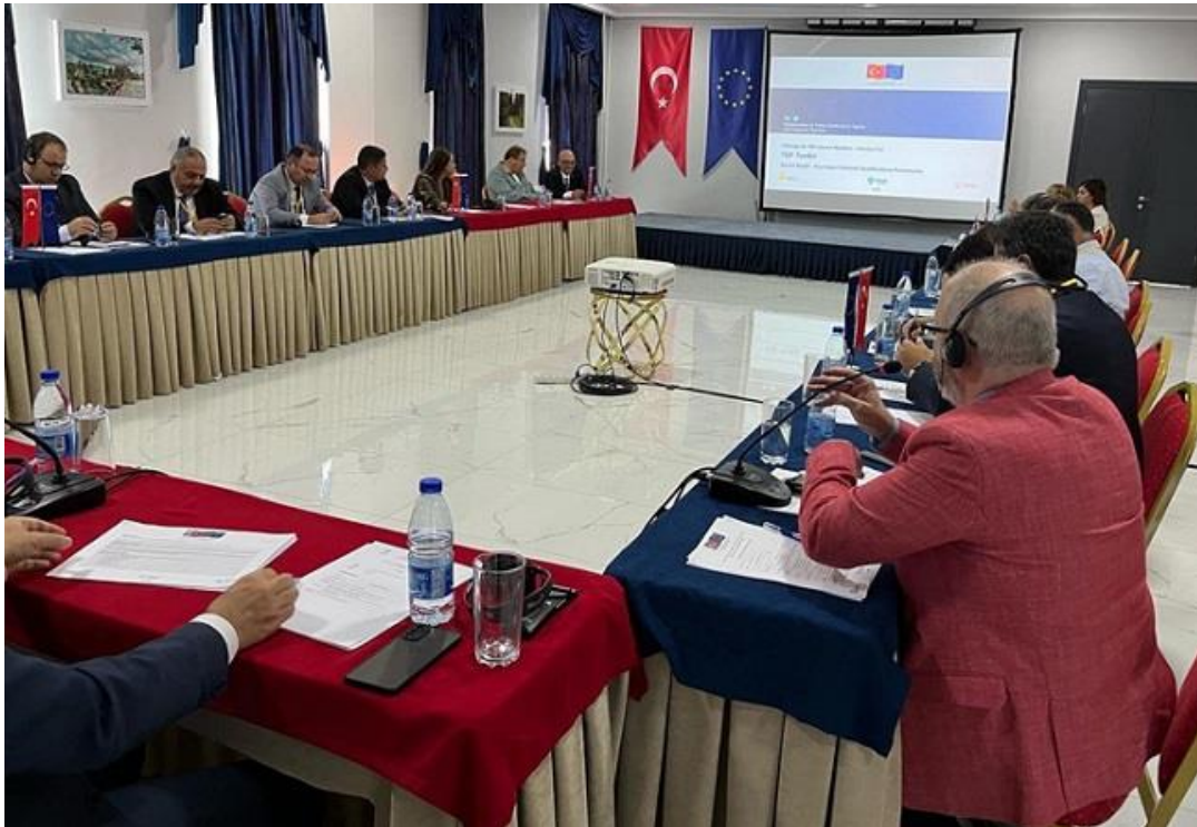
Resim: 03-04 Ekim 2022 tarihli TYÇ Kurulu Üyelerine Yönelik Eğitim

Etkinlik kapsamında dört farklı uluslararası uzman tarafından TYÇ Kurulu üyelerine kalite güvencesi, yeterliliklerin çerçeveye dâhil edilmesi, önceki öğrenmelerin tanınması ve etkin paydaş katılımı konu başlıklarında ayrıntılı bilgiler verilmiş, söz konusu konu başlıklarında uluslararası gelişmeler aktarılmıştır.