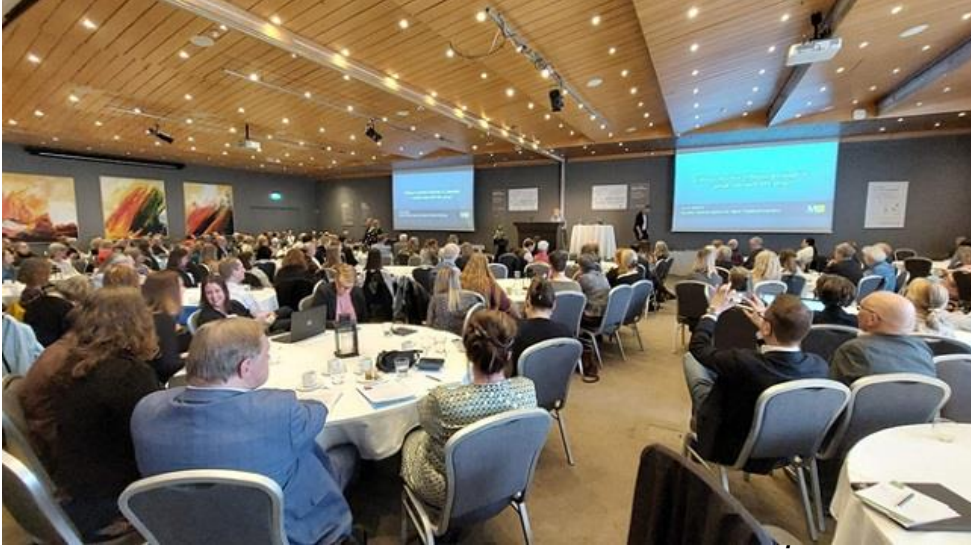
Resim: 19-20 Mayıs 2022 tarihli 4. Doğrulama Bienali-İzlanda