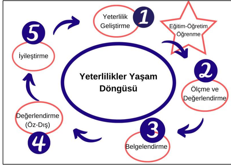
Şekil 1: Yeterlilik Yaşam Döngüsü

Her aşama açıkça tanımlanmış faaliyetleri içerir: