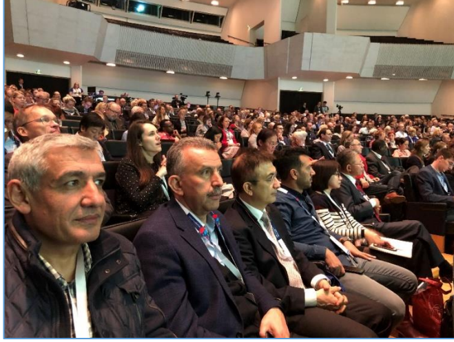
Avrupa Mesleki Beceriler Haftası