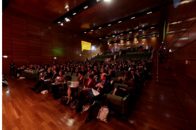
“Beceriler ve Yeterlilikler: İnsanlar için Faydalar” temalı ETF Konferansı