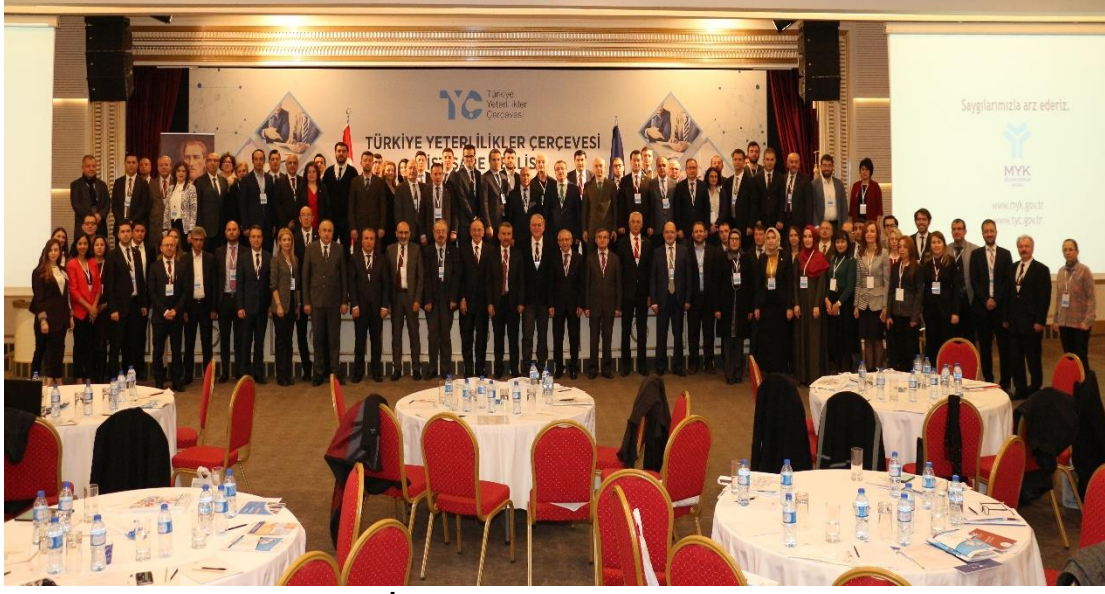
TYÇ İstişare Meclisi Birinci Toplantısı

TYÇ Yönetmeliği'nin 18. Maddesi gereğince TYÇ'ye ilişkin konuları değerlendirmek ve görüş bildirmek amacıyla TYÇ Kurulu'nun önerdiği paydaşların temsil edildiği İstişare Meclisi, TYÇ Koordinasyon Kurulu tarafından oluşturulmuştur. İstişare Meclisi'nde temsil edilen 92 kurum ve kuruluştan bazıları Cumhurbaşkanlığı Hükümet Sistemine geçiş sürecinde lağvedildiği veya başka kurumlara birleştirildiği için İstişare Meclisi'nin revize edilmesi ihtiyacı hâsıl olmuştur. Bu ihtiyaç doğrultusunda güncellenen TYÇ İstişare Meclisi 70 kurum ve kuruluşu içerecek şekilde 23. TYÇ Kurulu Toplantısında kabul edilmiştir.