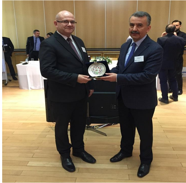
Macaristan’da düzenlenen Yeterlilik Veri Tabanları Toplantısı