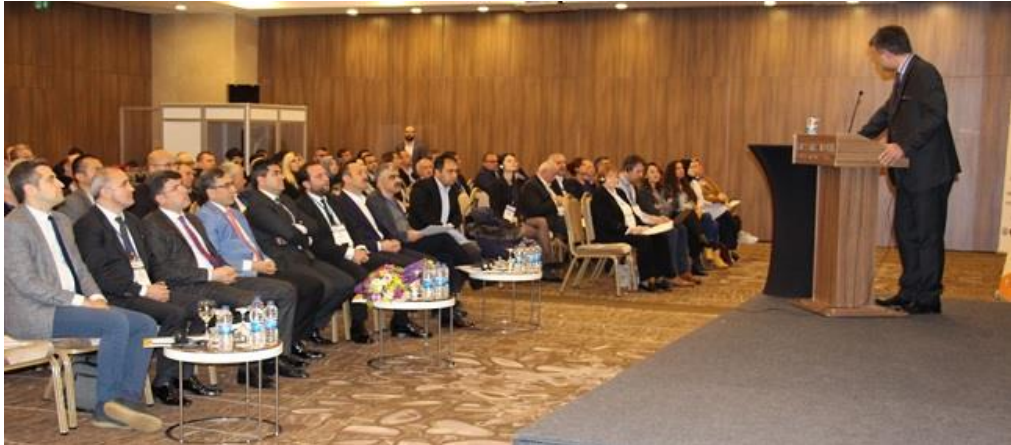
Önceki Öğrenmelerin Tanınması Konferansı