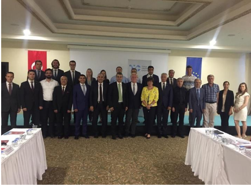
4 Temmuz 2019 Tarihli TYÇ Kurulu 21. Toplantısı

Bu hüküm gereğince, MYK tarafından işletilen kalite güvence sisteminin anlatıldığı Kalite Güvence Belgesi ve Zorunlu Rehberler, Türkiye Yeterlilikler Çerçevesi Dairesi Başkanlığı koordinasyonunda oluşturulan çalışma grubu tarafından hazırlanmış ve 4 Temmuz 2019 tarihinde düzenlenen TYÇ Kurulu 21. Toplantısı'nda sunulmuştur.