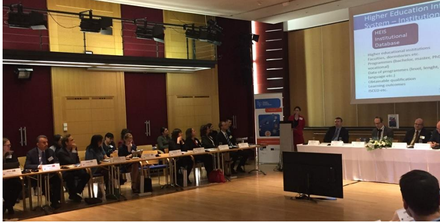
Macaristan'da düzenlenen Yeterlilik Veri Tabanları Toplantısı

Yılda ortalama dört kez düzenlenen AYÇ Danışma Grubu toplantılarına katılım sağlanarak Avrupa düzeyindeki ve diğer ülkelerdeki gelişmeler takip edilmekte, ülkemizdeki gelişmeler iletilmekte, istişarelerde bulunulmakta ve kurumsal temaslar geliştirilmektedir. Bu kapsamda rapor dönemi boyunca AYÇ Danışma Grubu'nun 48, 49, 50 ve 51. Toplantıları ile Macaristan'da düzenlenen Yeterlilik Veri Tabanları Toplantısı'na katılım sağlanmıştır.