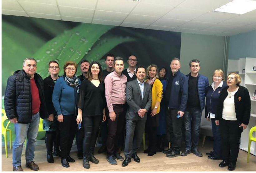
Fransa Çalışma Ziyareti